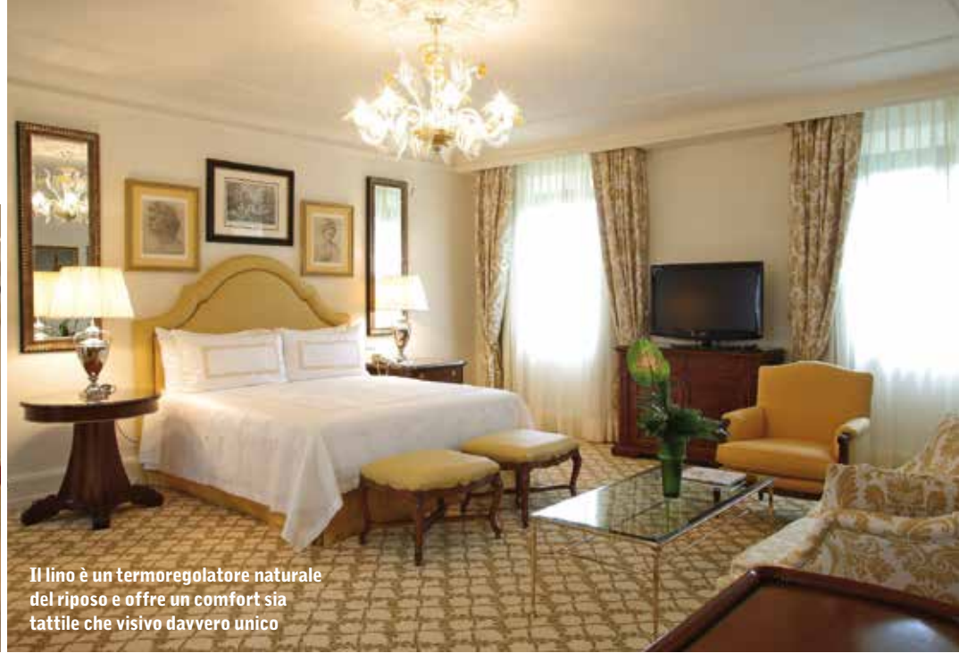
Il lino è un termoregolatore naturale del riposo e offre un comfort sia tattile che visivo davvero unico

riera che fa la camera e di manutenzione.” In termini di marketing, l’igiene garantita e dimostrata non è solo un valore dovuto al cliente, è anche un valore che va proclamato in maniera esplicita assieme a quelli del comfort e della sicurezza. È un valore che nasce da una certezza – di poter dimostrare ciò che si promette – e punta a una complicità con il cliente rendendogli noto ciò che si è fatto per raggiungere un simile grado di eccellenza affinché anche lui possa portarlo nella propria casa.