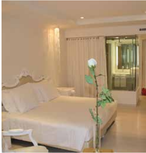
Il lusso in un albergo si manifesta anche con il puro lino, anzi con il LinoVivo di Pedersoli nella biancheria di camere e suite